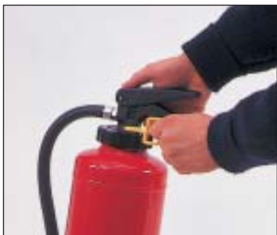
1. Sicherungsstift herausziehen

Der flexible Schlauch mit der Löschdüse ermöglicht das zielgerichtete Vorgehen am Brandort und den effizienten Einsatz des Löschmittels. Die Löschdüse erzeugt einen fein verteilten Sprühstrahl, der die Löschleistung erhöht. Die Wurfweite bis zu 5 m erlaubt einen guten Sicherheitsabstand.