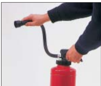
2. Ventil betätigen